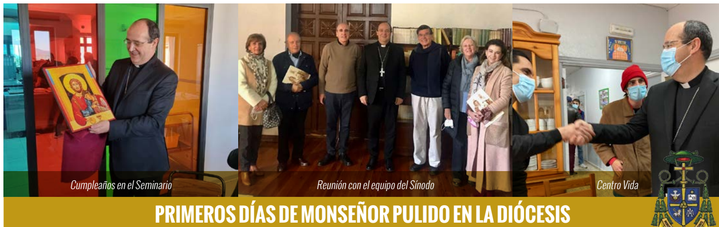
Cumpleaños en el Seminario