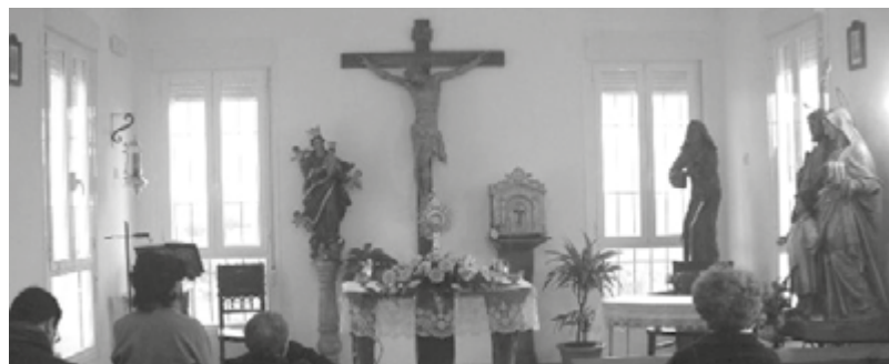
Centro de Espiritualidad Virgen de Guadalupe, Navas del Madroño

También se celebra un retiro mensual, pero en este caso el primer sábado de cada mes, en el Centro de Espiritualidad Virgen de Guadalupe (Viña de la Cruz), en Navas del Madroño . Para contactar con este lugar pueden llamar al número de teléfono 927 37 53 86.