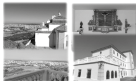
Centro de Espiritualidad Nuestra Señora de la Montaña, Cáceres

Uno de los objetivos de la Delegación de Espiritualidad este curso que comienza es el de ofrecer un retiro mensual que se celebrará el último sábado de cada mes, a partir de octubre, en el Centro de Espiritualidad Nuestra Señora de la Montaña . Más información en el Centro de Espiritualidad Nuestra Señora de la Montaña de Cáceres, en el 927 22 05 12, o bien en el 620 236 609.