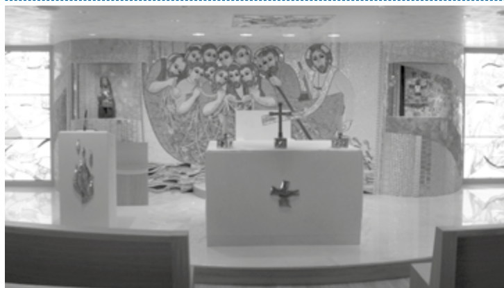
Capilla de la Sucesión Apostólica de la Conferencia Episcopal Española

El presidente de los obispos, el cardenal Juan José Omella, arzobispo de Barcelona, ha presentado el documento Fieles al envío misionero aprobado por la Asamblea Plenaria de abril.