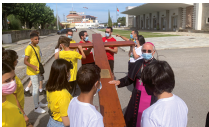
Los símbolos de la JMJ llegaron a la frontera con España el domingo, 5 de septiembre, a Fuentes de Oñoro (Diócesis de Ciudad Rodrigo)

10:30 h Entrega de los símbolos a la Diócesis de Plasencia.