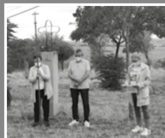
MARCHA POR EL TIEMPO DE LA CREACIÓN EN CORIA Y VÍA CRUCIS