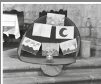
ORACIÓN DE APERTURA DEL TIEMPO PARA LA CREACIÓN EN EL PALANCAR (1 DE SEPTIEMBRE DE 2021)

Este es el momento para que levantemos juntos una voz profética y renovemos nuestro llamado bautismal a cuidar y sostener dignamente nuestra casa común.