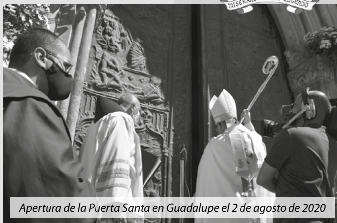
Apertura de la Puerta Santa en Guadalupe el 2 de agosto de 2020