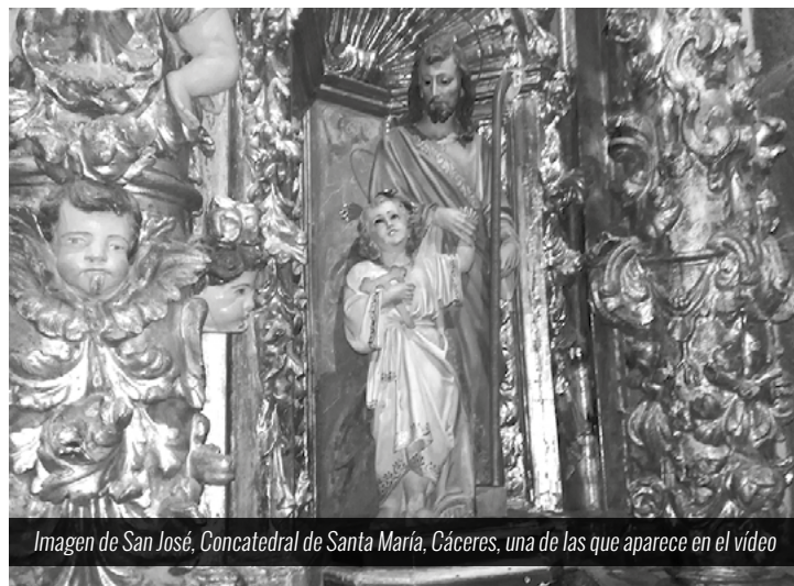
Imagen de San José, Concatedral de Santa María, Cáceres, una de las que aparece en el vídeo

Antes de que termine este año dedicado a San José, se invita a todos los que quieran participar en la iniciativa, a enviar las imágenes de San José desde todos los rincones de nuestra diócesis, puesto que se publicará otro vídeo con aquellas que lleguen a comunicacion@diocesiscoriacaceres.es y a parroquiasanignaciocoria@yahoo.es . Simplemente hay que indicar la procedencia de la imagen.