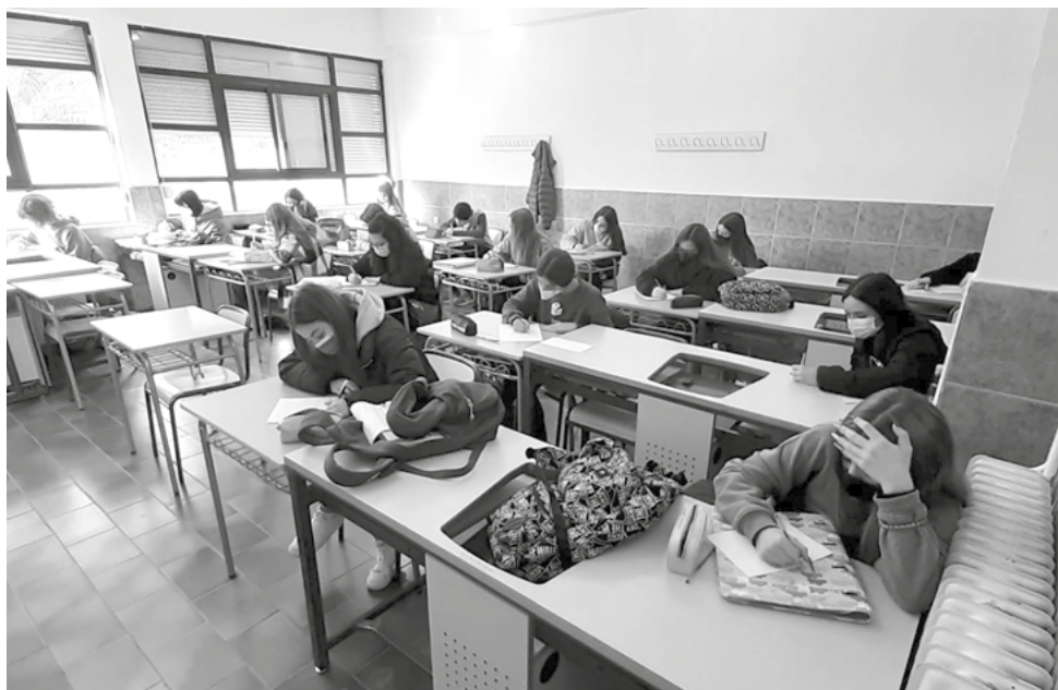
Uno de los tres grupos de 4.º de la ESO que han participado. IES EL BROGENSE - CÁCERES