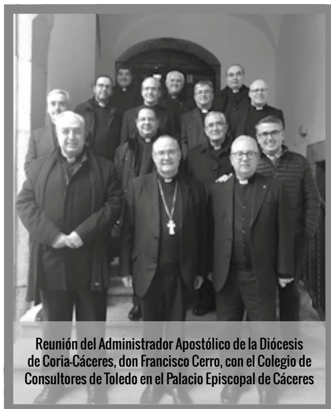
Reunión del Administrador Apostólico de la Diócesis de Coria-Cáceres, don Francisco Cerro, con el Colegio de Consultores de Toledo en el Palacio Episcopal de Cáceres

El curso cuenta con 15 plazas, y está cofinanciado por el Fondo Social Europeo, Programa Operativo 2014-2020, dentro del programa de formación "Fénix".