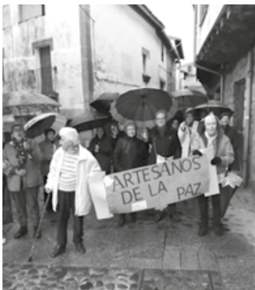
SAN MARTÍN DE TREVEJO

Esta marcha en Cáceres comenzó por iniciativa de los jóvenes de la Parroquia de Guadalupe de Cáceres, tras los atentados contra las torres gemelas de Nueva York, en 2001. Comenzaron con una jornada educativa por la paz y culminaron con la marcha en la que invitaron a la comunidad islámica y a protestantes. A ella han acudido como cada año, personas de todo tipo que compartían estos valores. Además, la marcha se ha celebrado también en varios pueblos de la zona norte de la diócesis, en Sierra de Gata (San Martín de Trevejo, Cadalso, Villasbuenas de Gata y Perales del Puerto).