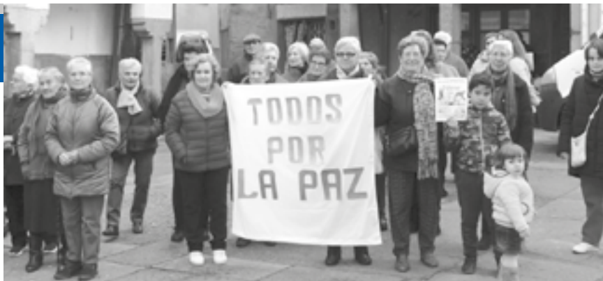
PERALES DEL PUERTO