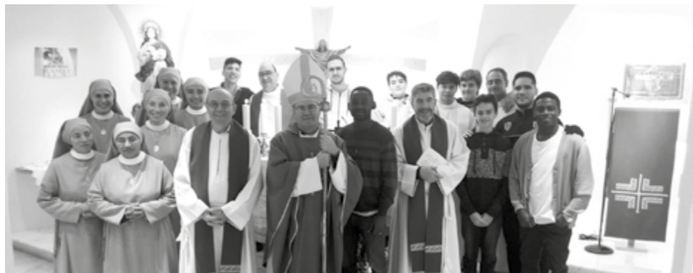
— Visita del obispo al Seminario al comienzo del curso —

Rezad y sed generosos con nuestro Seminario.