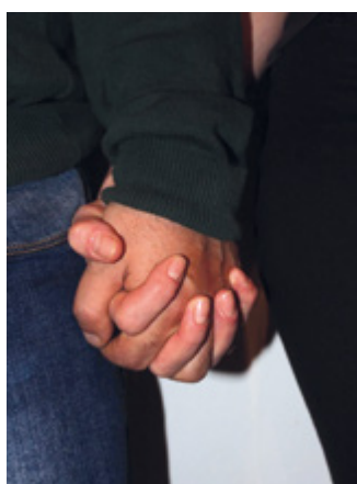
Certamen Vocacional – 2.º premio Fotografía – Amor