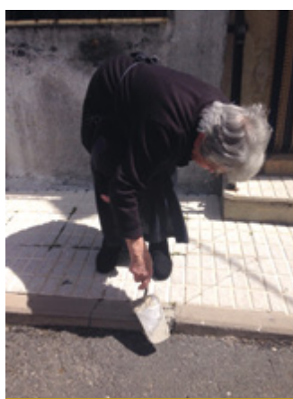
Certamen Vocacional – 1.º premio Fotografía – La edad solo es un número