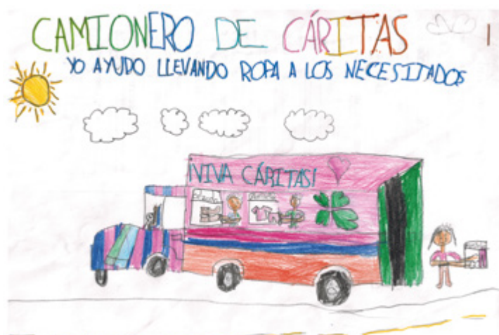
Certamen Vocacional – 1.º premio Dibujo – CAMIONERO DE CÁRITAS