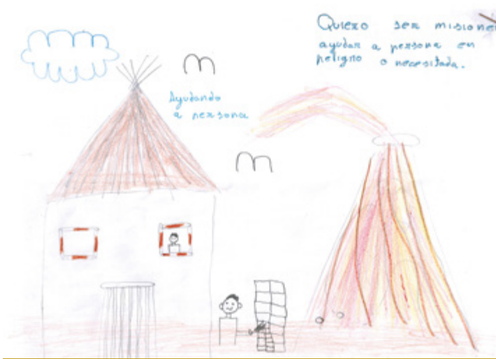
Certamen Vocacional – 2.º premio Dibujo – AYUDANDO A PERSONAS