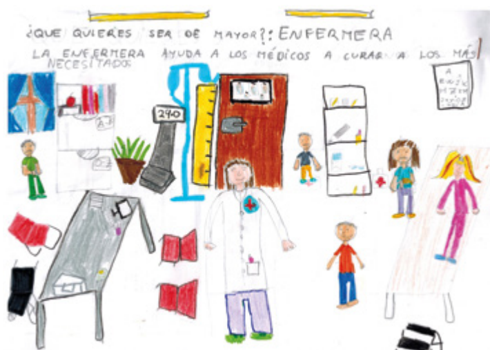
Certamen Vocacional – 2.º premio Dibujo – ¿QUÉ QUIERO SER DE MAYOR