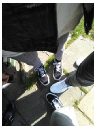
Certamen Vocacional – 3.º premio Fotografía – Unidos somos más fuertes