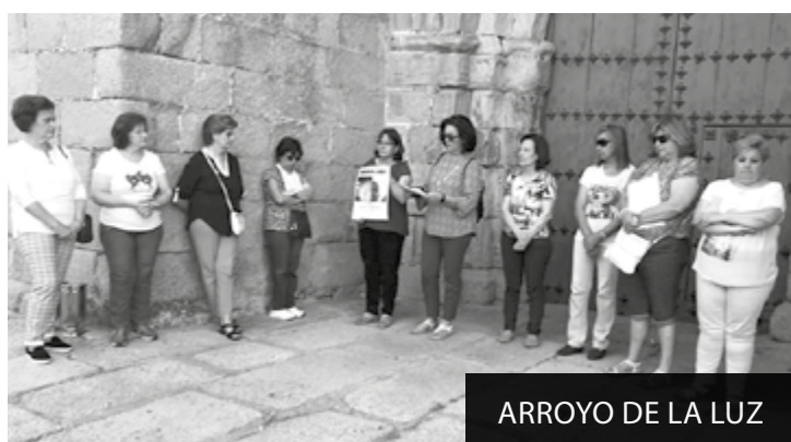
ARROYO DE LA LUZ

El jueves, 30 de mayo, a las 20:00 horas, en la Plaza de San Juan de Cáceres, como cada último jueves de mes, Cáritas convocó a la sociedad en el Círculo de Silencio, por el cuidado del Medio Ambiente.