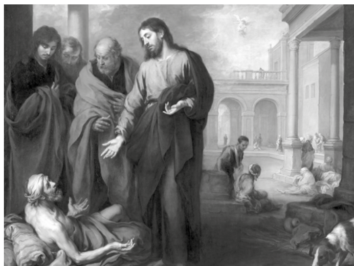
Murillo - Curación del paralítico en la piscina probática. Año 1670

Pintores e instituciones han recibido un curioso encargo: pintar un cuadro referente a escenas de la Biblia, relacionadas con la discapacidad y la enfermedad. Se trata de una iniciativa muy interesante que parte de la Delegación Diocesana para la Atención de Personas con Discapacidad. Los artistas o entidades interesados en colaborar pueden contactar en el e-mail: discapacidad@diocesiscoriacaceres.es