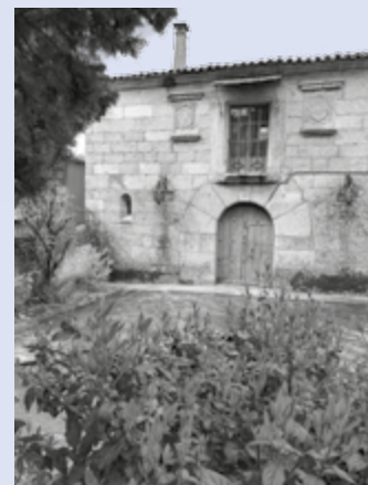
ANTIGUO PALACIO EPISCOPAL LAGUNILLA

...Restaurada la Sede Cauriense en el año 1142, desde esta fecha hasta el año 1867, fue sufragánea de la Archidiócesis de Santiago de Compostela; desde 1867 hasta 1994 perteneció a la Archidiócesis Primada de Toledo y que el 28 de julio de 1994, por Bula del papa Juan Pablo II, se erige la Provincia Eclesiástica de Mérida-Badajoz y desde entonces, la Diócesis de Coria-Cáceres, pasa a ser sufragánea de la Archidiócesis de Mérida-Badajoz. ¿Y sabías que hasta 1958 hubo distintos arreglos parroquiales, (reestructuración de los arciprestazgos) y que muchas de las poblaciones que hoy pertenecen a la Diócesis de Salamanca pertenecieron a la Diócesis de Coria? Entre ellas: La Alberca, Lagunilla, Sotoserrano, Montemayor, Peñacaballera, Valdela-matanza, El Cerro, Colmenar...?