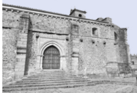
IGLESIA PARROQUIAL DE MONTEMAYOR