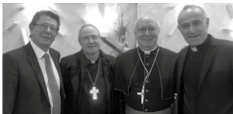
El secretario, vicario general y obispo de Coria-Cáceres, junto con el obispo emérito de Albacete, Ciriaco Benavente