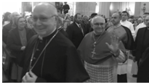
Ángel Fernández, nuevo obispo de Albacete, durante la celebración

Las campanas tocaban a fiesta el sábado 17 de noviembre. Albacete tiene un nuevo obispo, monseñor Ángel Fernández. El sexto en el orden de sucesión. La catedral engalanada con miles