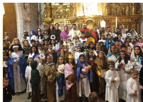
Celebración de "Holywins" en Alcuéscar

La Iglesia Católica depende únicamente de las aportaciones de los fieles y del 0,7% de la cuota íntegra de los contribuyentes que marquen en su declaración del IRPF la casilla correspondiente. Es el momento de participar más activamente en el día a día de nuestra Iglesia, no solo apoyando la labor y las actividades de la parroquia, sino también demostrando nuestra corresponsabilidad económica, por ejemplo con suscripciones