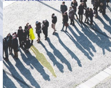
Diócesis de Coria-Cáceres

7 OCTUBRE. CÁCERES SEMINARIO DIOCESANO. 17 HORAS