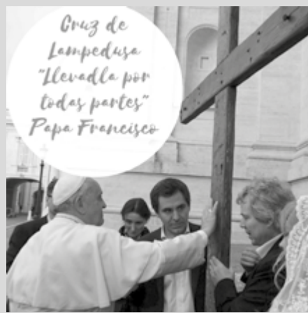
El papa bendice la Cruz de Lampedusa el día de su presentación

La iniciativa ha sido promovida por la fundación "Casa del espíritu y de las artes", que