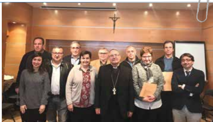
“El obispo junto a algunos de los nuevos delegados en la presentación del nuevo organigrama”