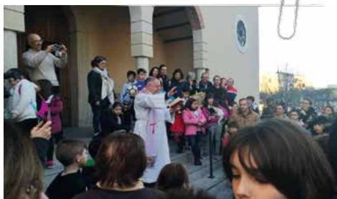
Bendición de mascotas en la puerta de la parroquia de San Ignacio, con motivo de la celebración de San Antonio Abad