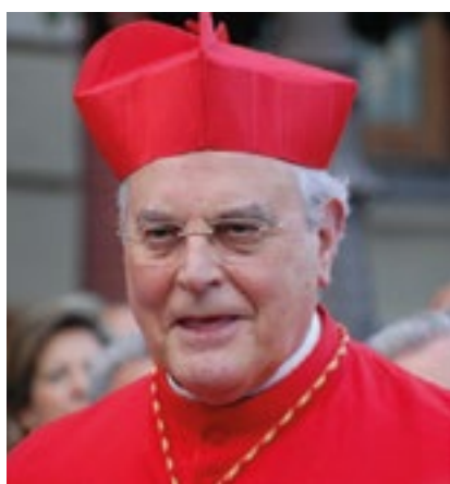
Ignacio de Rodrigo Esteban Hermandad de Nuestra Señora de Guadalupe y San Pedro de Alcántara