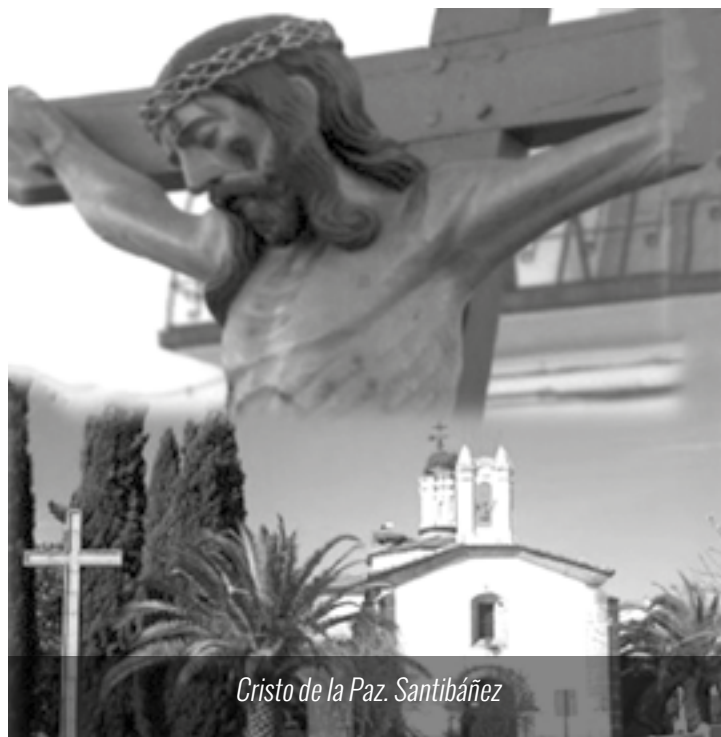
Cristo de la Paz. Santibáñez

Dentro del tiempo de novenas del Cristo de la Paz de Santibáñez el Bajo, el grupo de Cáritas Parroquial del municipio ha llevado a cabo un acto de sensibilización sobre las causas de la pobreza.